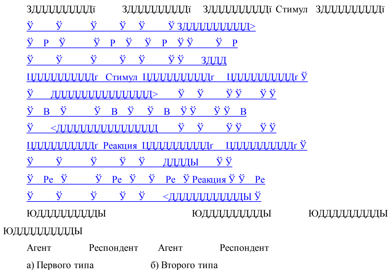
Схема 2. Дополнительные транзакции

*Обе* вышеописанные транзакции мы называем *дополнительными*. Иными словами, при нормальных человеческих отношениях стимул влечет за собой уместную, ожидаемую и естественную реакцию. Первый пример (его классифицируем как дополнительную транзакцию первого типа) представлен на схеме 2а. Второй (дополнительная транзакция второго типа) показан на схеме 2б.